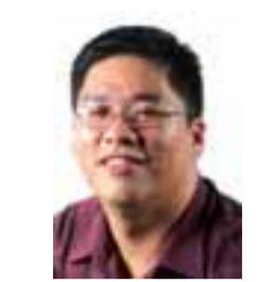
报道 ■ 林杰