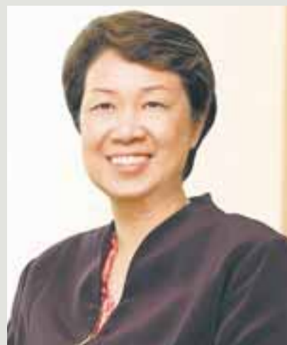
何晶 (56岁) 现职：Temasek Holdings总裁 之前：1997年—2001年担任Singapore Technologies总裁